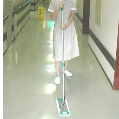
清掃は、施設の美観を維持し、長持ちさせる役割を担います。